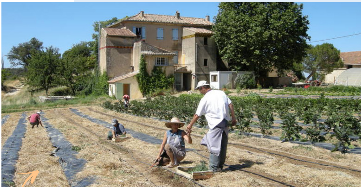
Le Grand Réal, un des établissements de l'association*.

Avec ses 45 ans d'expérience, ses 10 établissements, ses plus de 200 résidents et 250 salariés, l'association La Bourguette fait référence dans le domaine de l'autisme.